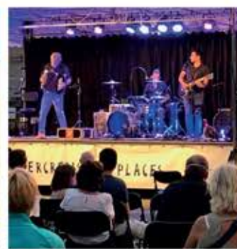
Cadre de vie Un été sur Places P.12