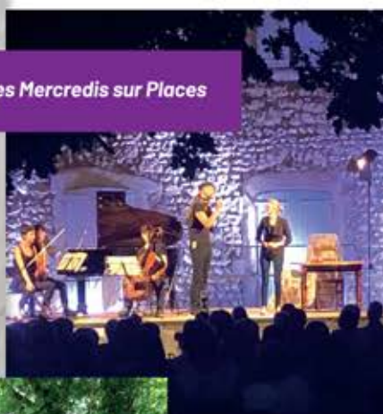
Les Mercredis sur Places

Suivez les actualités de St Jean sur Politeia.com