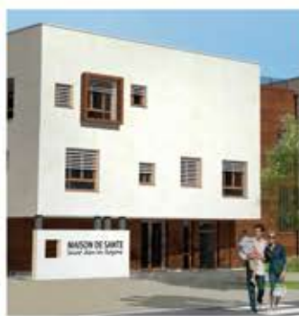
Travaux La Maison de Santé P.8