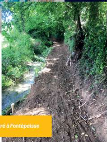
Un chemin restauré à Fontépaise

Suivez les actualités de St Jean sur Politeia.com