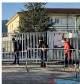
Vie scolaire La rentrée 2020 P.6