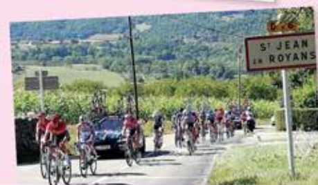
Etape de St Jean Tour Cycliste Féminin International de l'Ardèche