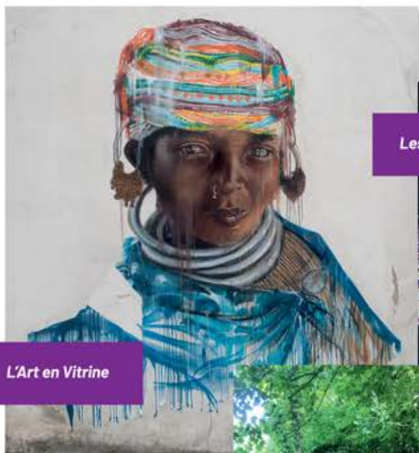
L'Art en Vitrine