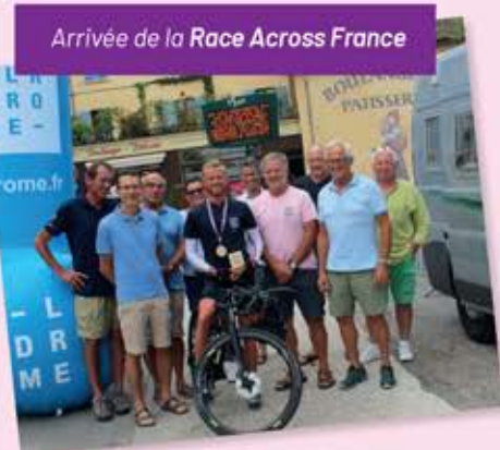
Arrivée de la Race Across France