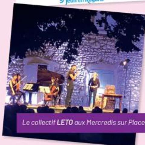
Le collectif LETO aux Mercredis sur Places