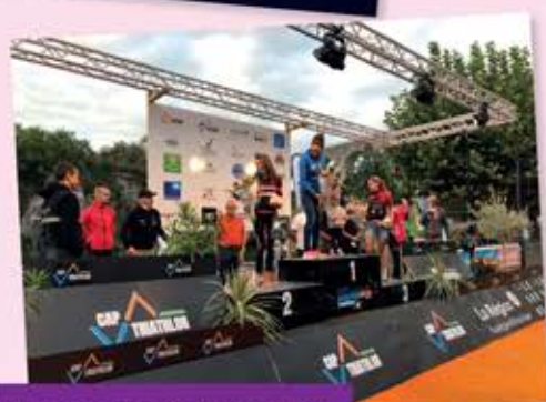
Remise des prix Vercorsman