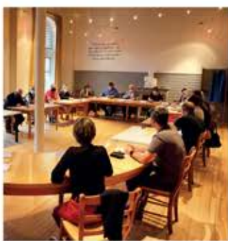
Vie municipale L'Écho des Conseils P.3