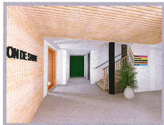
Perspective : Benjamin Ballay architecte

Cout total de l'opération MSP 2 263 837 €