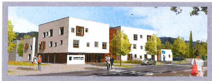
Perspective : Benjamin Ballay architecte

La commune a bénéficié de l'accompagnement du CAUE tout au long de la définition du projet avec les futurs utilisateurs et dans le cadre de l'impact urbanistique des travaux de la friche Cluse.